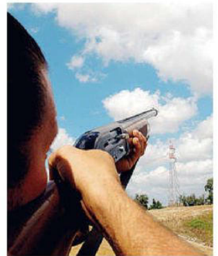
Lite per la zona di caccia

arrivato in elicottero al Noa di Massa, è stato operato d'urgenza e poi ricoverato in Rianimazione: le sue condizioni sono molto gravi.