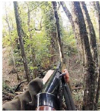
FUOCO Colpito da un compagno