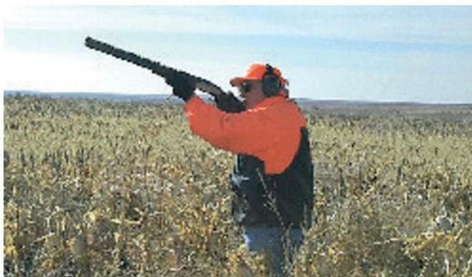
Incidente di caccia nelle campagne di Campli