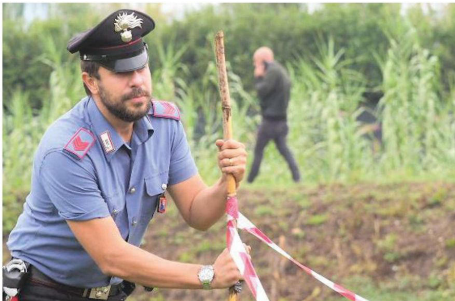
INDAGINI I carabinieri delimitano l'area dove è stato ferito il 47enne a causa della lite degenerata: adesso il cacciatore è accusato di tentato omicidio

Il 47enne ferito soccorso in elicottero e operato d'urgenza a Massa