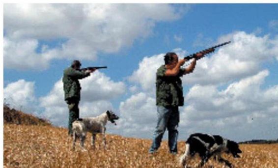
Incidente di caccia nelle campagne di Campli