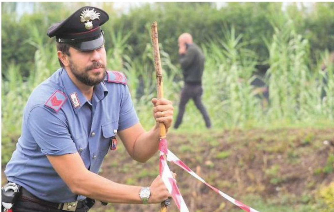
INDAGINI I carabinieri delimitano l'area dove è stato ferito il 47enne a causa della lite degenerata: adesso il cacciatore è accusato di tentato omicidio

Il 47enne ferito soccorso in elicottero e operato d'urgenza a Massa