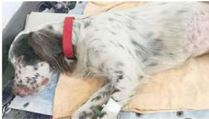
Il setter investito da un'auto pirata e soccorso dai volontari

I testimoni raccontano che la persona alla guida "non ha neanche rallentato". Dopo un padrone crudele, il setterino ha incrociato un altro essere umano senza sentimenti. Grazie a chi ha visto, a chi s'è sentito in dovere di fermarsi, e l'ha raccolto, ora sta combattendo per la vita. L'investimento è avvenuto nel territorio di Sarzana: lo sfortunato esemplare, è appoggiato al canile comunale della Spezia. Il piccolo è stato operato, testimonia la direzione del canile, e sta benino. Trauma cranico, fratture, terrore. Dovrà