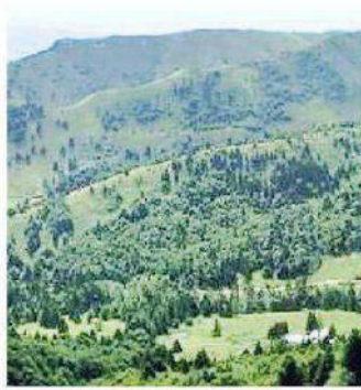
La zona di malga Camparona