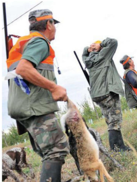
Sembra che lo sparo sia stato accidentale: il fucile sequestrato dalla polizia

A settembre un uomo in località La Valle di Vernio si era colpito alla mano con uno sparo