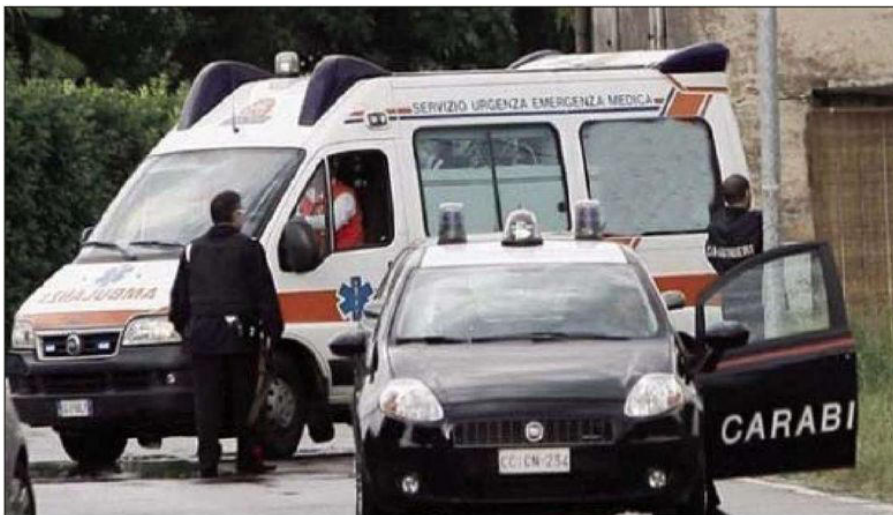
Molto probabilmente alla base del ferimento c'è un incidente causato da una battuta di caccia

Le indagini dei Carabinieri per identificare gli autori