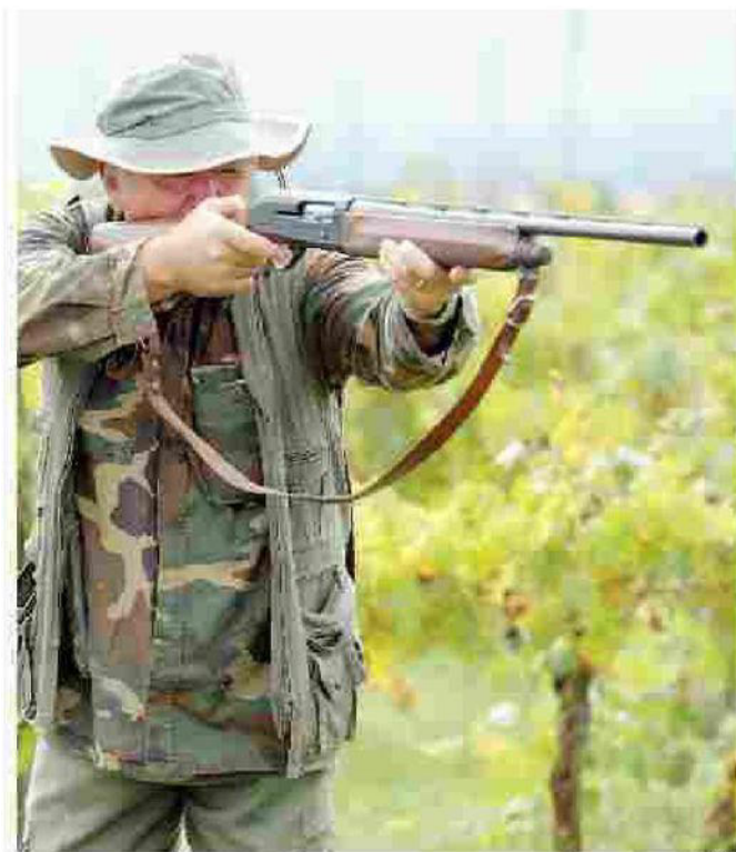
È iniziata la stagione della caccia alla fauna migratoria

to per 621 cacciatori con la scusa della tutela dell'olivicultura». Intanto la pioggia continua a farsi desiderare e gli agricoltori invocano aiuti per la grave situazione climatica in corso. «Un'emergenza che invece viene negata alla fauna selvatica in favore della caccia: due pesi e due misure, come al solito, come sempre», sottolineano i responsabili dell'Enpa savonese. [G.B.]