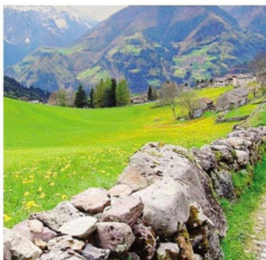
Spiazzi di Gromo, Parco delle Orobie

Al centro delle critiche l'art. 5 del disegno di legge dei parchi, approvato alla Camera