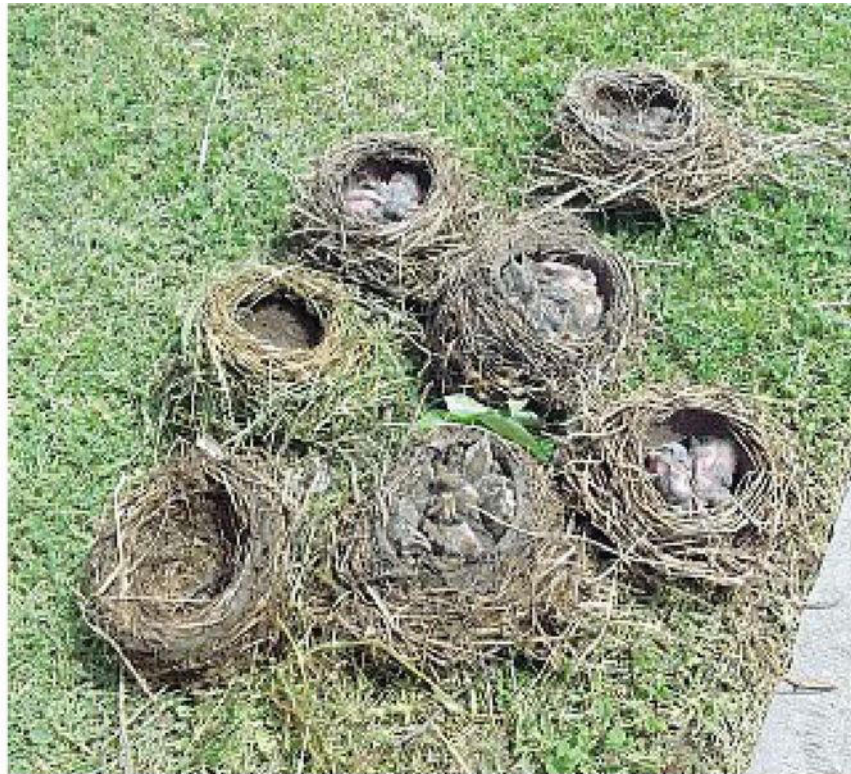
Salvati Alcuni nidi di tordi recuperati dagli uomini del corpo forestale della Provincia

● I forestali hanno recuperato 350 turdidi e denunciato venti bracconieri. Scoperto un traffico illecito di uccellini da richiamo