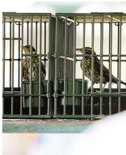
Le fiere degli uccelli aprono sempre con le gare di canto delle varie specie alate