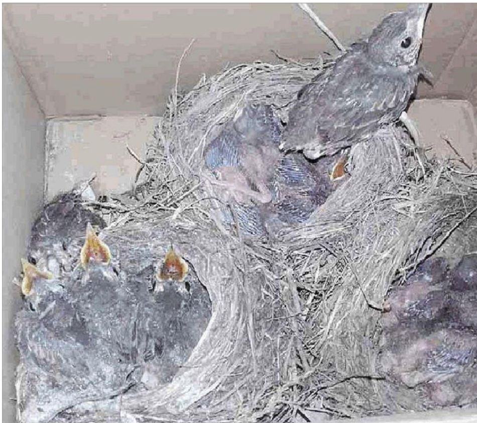
Alcuni piccoli di tordo sequestrati e un nido trovato vuoto

In Veneto e Lombardia un florido mercato nero: per un uccello da richiamo anche 250 euro. I pulli accolti al Centro recupero avifauna di San Rocco gestito dalla Lipu