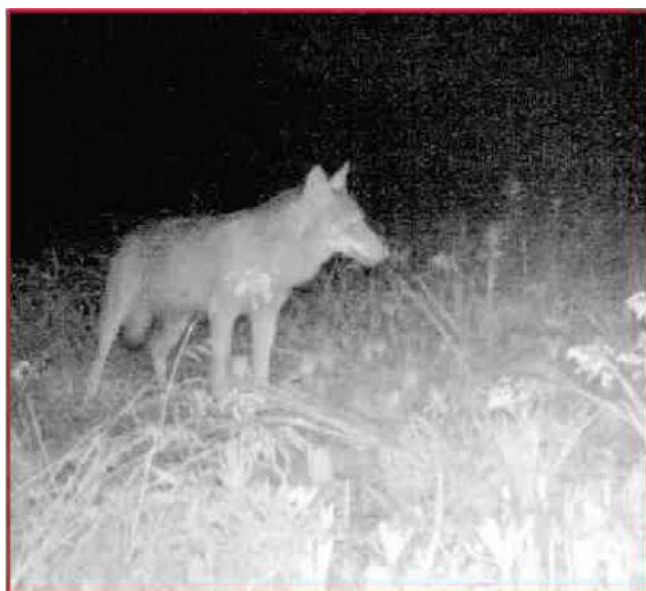
Il video Qui sopra l'immagine della telecamera a infrarossi che registra il passaggio del lupo Sopra una veduta aerea del parco del Ticino

è senz'altro un indice di conservazione del territorio - continua Franchina -. Questi predatori cercano zone non battute, dove l'habitat è ancora quello delle origini. Le loro abitudini vanno però studiate e controllate perché questi animali possono attaccare le greggi. Invece non è ancora chiaro quanto possano incidere sull'equilibrio generale dell'ecosistema».