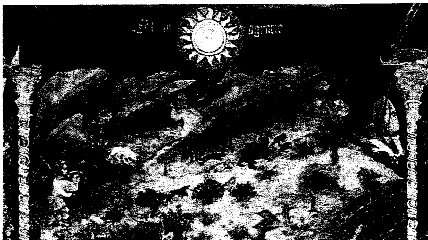
Castello del Buonconsiglio, Torre Aquila, Trento. Maestro Venceslao, Ciclo dei Mesi (1400 circa), mese di novembre (particolare).

Le preoccupazioni delle genti di montagna, di cui i cacciatori sono parte e di cui anche gli allevatori sono una componente fondamentale, vanno prese sul serio. Intervenire su individui problematici (che per esempio si specializzano nella predazione di domestici) e la sola prospettiva che un giorno anche i grandi carnivori, pur a condizioni base quali la vitalità di